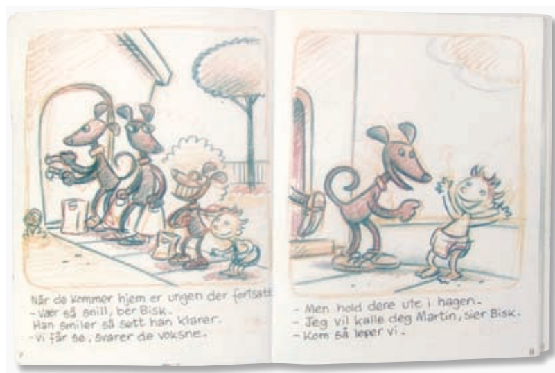
Skisser til boken Bisk får en liten unge . Hovedfiguren Bisk er en liten hundevalp som finner en gutt uten foreldre. Han maser seg til å få lov til å ta med ungen hjem.

– I andre omgang arbeider jeg fram en utgave med blyanttegninger, som er i riktig størrelse og så likt det ønskede resultat som mulig.